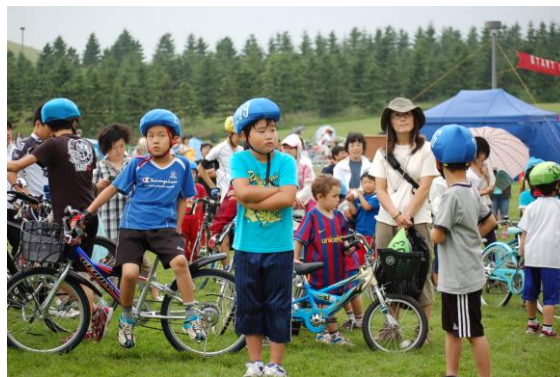
今日は寒いな これから開会式と安全教室