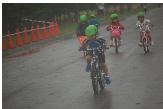
幼児 雨の中の力走