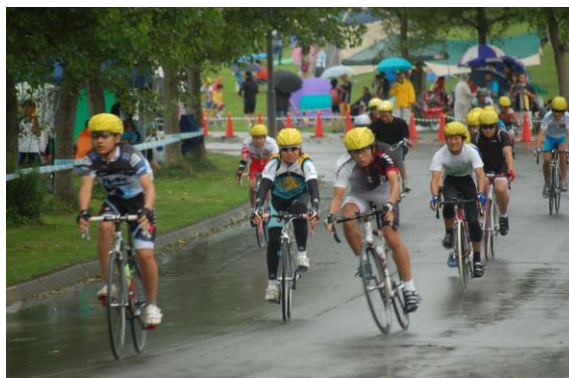
高学年ともなれば一流かな