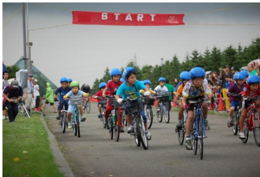
中学年は力強いね