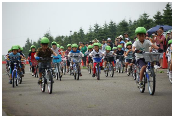
低学年のスタート